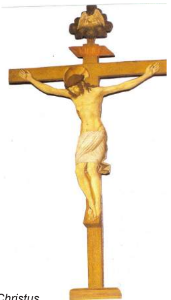
Kruisiging van Christus midden 15e eeuw Italie